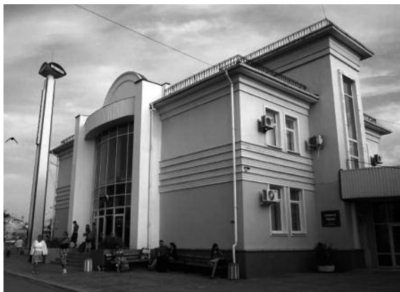
Автовокзалы в Енакиево (1961 г.) и Евпатории (современное фото)