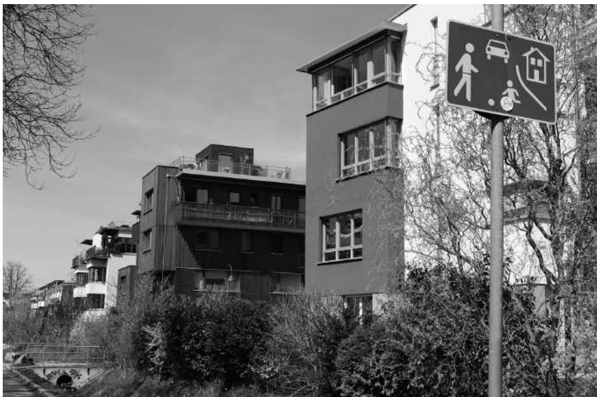
1. Екологічний район Вобан. Фрайбург. Німеччина.

міст почала застосовувати екологічні програми у контексті урбаністичного розвитку. Далі, Agendas '21 1 була розроблена навмисно для органів місцевого самоврядування з метою розвинути останні з «еко-управління» (сортування відходів, громадський транспорт, зелені насадження, переробка санітарних відходів...) до «еко-будування». Органи місцевого самоврядування, що найбільш зацікавлені у просуванні сталого розвитку, зобов'язані звернутися до теми реабілітації існуючих районів, які не відповідають новим екологічним стандартам. Однак, термін еко-район не був застосований з початку процесу еко-рекваліфікації міст. Наприклад, Анже — одне з перших французьких міст, що розпочало працювати над проектами урбаністичного відновлення 2002 року — віддало перевагу терміну сталий район , на відміну від еко-району .