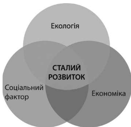
2. Схема концепту сталого розвитку

сується терміну сталого розвитку 2 , що, на думку багатьох, має бути замінений на стабільний розвиток 1 » [3, с. 10]. У книзі «Еко-райони» [3] вони пропонують декілька варіантів визначення терміну. Перший варіант — університетський. Він використовується у колах Міністерства екології, енергоресурсів, сталого та територіального розвитку (MEEDDAT) 2 . Другий варіант було визначено Обласною адміністрацією Лілля (LMCU) 3 під час здійснення програми урбаністичного відновлення із використанням концепту еко-району.