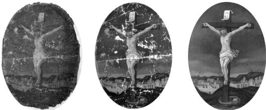
13. «Розп'яття» 1806 р. маістра А.Н.(?). Холст, масло. НВФ-1999. Національний художній музей республіки Білорусь. Вигляд до реставрації.