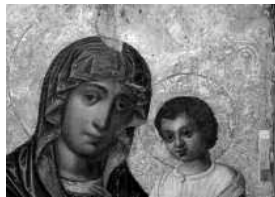
1. Богоматір Одигітрія. XVII ст. Дерево, темпера. КП-12470. Національний художній музей республіки Білорусь. Вигляд до реставрації. 2. Те саме. Вигляд на завершальному етапі реставрації. 3. Те саме. Деталь. Вигляд до реставрації. 4. Деталь. Вигляд після розкриття та в процесі тонування

Одним з найбільш ранніх з творів білоруського іконопису є образ Богоматері Одигитрії (КП-12470) [1, с. 161–176], який датується XVII століттям. Ікона надійшла до музейної збірки у досить поганому стані. Було очевидно, що зображення неодноразово поновлювалося, тло було перелевкашене та позолочене, на живописі були помітні сліди опіків, залишилися отвори від цвяхів, якими кріпили оклад, лак потемнішав і став розкладатися. Ікона була датована, на момент надходження до збірки, кінцем XVIII–XIX ст.