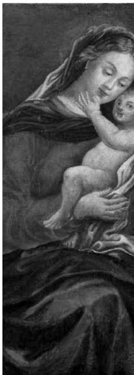
5. Богоматір Замилування. XVIII ст. Холст, масло. КП-17839. Національний художній музей республіки Білорусь. Вигляд до реставрації.