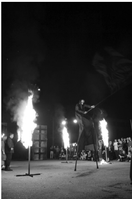
«Carmen Funebre», Познань, Польща

роди і зробив світ ненаситно ненажерливим до звуку; його творчість явила собою альтернативу музиці пауз, тиші, середовища і атмосфери» [2, с. 1]. Проект візуальної програми «Гра в реальність» будується на контрверсійному ставленні до проблематики, на діалектиці Гегеля, на бінарних опозиціях. Авторський проект «Нотаже Ксенакісу» апелює до ідеї паралаксного бачення Жижєка, об'єднує присутність непереборного паралаксного розриву, зіставлення двох тісно пов'язаних перспектив, між якими неможливі ніякі нейтральні точки зіткнення [3, с. 12].