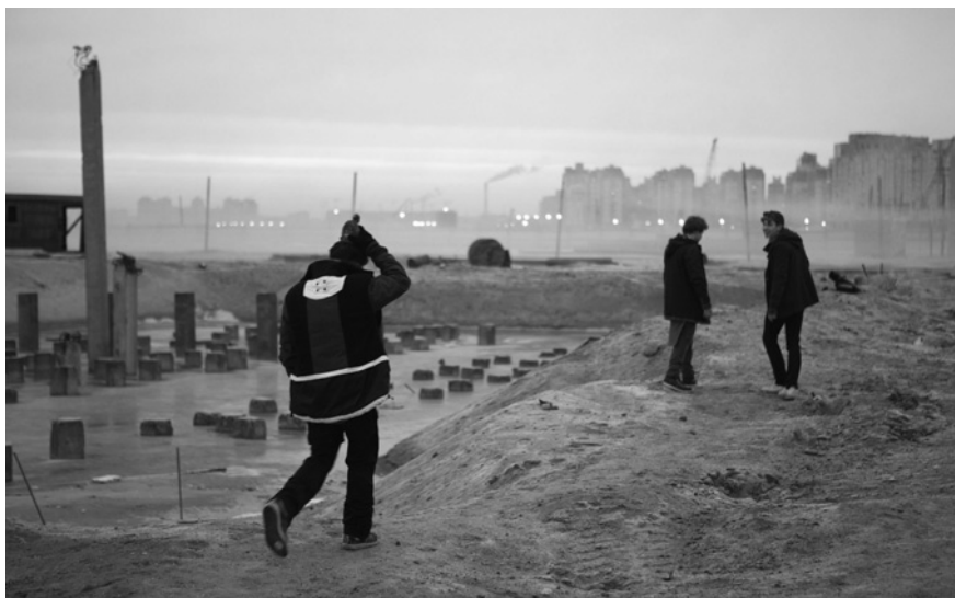
Олексій ГЕРМАН (молодший) . «Під електричними хмарами», Україна, Росія, Польща, 2015

Камерна опера-реквієм Влада Троїцького на старозавітні біблійні та латинські сакральні тексти для рояля, ударних, віолончелі та солістів «Мистецтво миру. Частина II. Опера для препарованого рояля, віолончелі та голосів. Йов», здається, підкорила абсолютно всіх. Авторами музики є Роман Григорів та Ілля Разумейко. Інструментальний театр, імпровізаційна музика й інтерпретація сакральних текстів викликали і громадянську альянцію на долю України, яку Бог як Йова проводить через найтяжчі випробування, і індивідуальний та колективний катарсис.