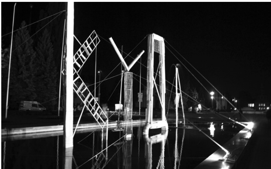
Джон МЕЛВІН. Кінетична інсталяція , 2015

му Євромайдані та функціонуванні суспільного простору за умов парадигматичних змін. Відео працює з наукою, урбанізмом та історією і стосується розуміння нашого часопростору, досліджуючи співвідношення між минулим та теперешнім часом і майбутніми трансформаціями суспільства. За експериментальних умов колайдери досліджують квантові частки під час зіткнень одна з одною, аби виробляти дивну речовину, антиречовину. За планетних умов ми досліджуємо людські частки під час зіткнень, які виробляють випадкову речовину, сильну речовину, дискурсивну речовину, політичну речовину, етичну речовину, речовину великої ваги. Взаємодія між мікро- і макросистемами, між фізичними і соціальними світами досліджує різноманітність сучасних та історичних явищ. Відео об'єднує науку, історію з економічними, суспільно-політичними проблемами для того, щоб наблизитися до розуміння зв'язку між часопростором, історичними перспективами і взаємодією між людьми. Залучаючи українські події у глобальний вернакуляр, проект свідомо формує глобальне розуміння сучасної історії і в той же час перосмислює розуміння локальних і всесвітньо-історичних переломів. Геополітична колізія, в якій опинилася Боснія 1914 року, призвела до всім відомим наслідків. Геополітична колізія, в якій опинилася Україна 2014 року внаслідок агресії Росії, призвела до того, що світ знаходиться за один крок від Третьої світової війни. Відео, що живиться складною історією, політичною нагальністю і документом, виступає як каталізатор