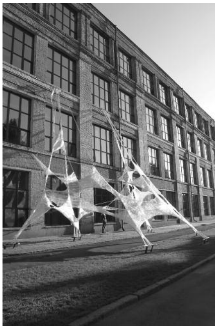
7. «СКУЛЬПТУРНИЙ ЦЕХ. СПЕЦПРОЕКТ», site-specific інсталяція, 2016

трьох сценах: в Бункері, на Зеленій відкритій Сцені, на Atlas Stage та фінальний концерт «Hamlet» — драма для тромбона Еліаса Файнгерша (Ізраїль) і Державного естрадно-симфонічного оркестру України на сцені Літери Б, чому може бути присвячена окрема стаття. Мені пощастило насолодитися концертом «Контури (від)звуку» колективу «Sed Contra Ensemble», що досліджує простір звуку, виконуючи твори композиторів таких, як Яніс Ксенакіс, Алла Загайкевич, Кайя Сааріахо, Сальваторе Шарріно, Фірудін Аллахверді, Андрій Мерхель, Сергій Вілка, Дмитро Пашинський. Локація, обрана для музичної програми в Бункері, була готовою тотальною інсталяцією, що є проекцією епохи холодної війни. Це був справжній бункер з бомбосховищем, побудованим для захисту від можливого американського нападу, де в кожній кімнаті висіли табло з планами евакуації, що мали висвічувати кількісні показники евакуйованих машин, готових до евакуації і необхідних до підготовки, от тільки всі дрти давно зотліли. Іронією, в цьому сенсі, виглядає міць мілітаристської машини в часи СРСР і сьогоднішня наглядна безпорадність, коли загроза ядерного нападу РФ стала реальністю.