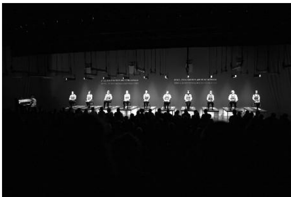
10. ЛИТОВСЬКИЙ ФОКУС: опера «ГАРНОГО ДНЯ!»

у синергію, якби тільки це була власна інтонація і стилістика, а не запозичена в Івана Вирипаєва з його п'єси «Кисень», авторську манеру виконання якого старанно відтворили 3 виконавиці.