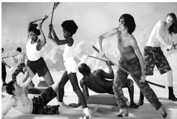
1. AES+F «Last Riot» / «Останній бунт», 2007

ської України. Тема статті пов'язана з загальнодержавною програмою ІПСМ НАМ України, зокрема з темою «Культурна і мистецька спадщина: дослідження, реставрація, збереження».