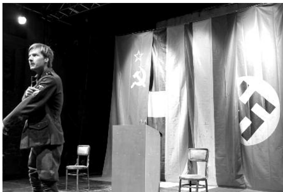
9. «ЛЕГІОНЕРИ» Латвійський «Театр на вулиці Гертрудес»

Генерального консульства ФРН в Дніпропетровську, Дому Нюрнберга та Почесного консульства ФРН. Вистава швидко стала культовою. В рамках ГогольФесту вона відбулася в театрі «Молодий». Це жорстка, провокативна та іронічна, розмова про хворобливий процес дорослішання в умовах українських 1990-х, втілена в естетиці німецького сучасного театру.