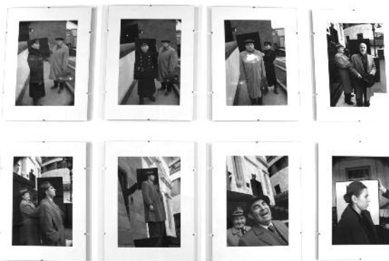
2. Борис Михайлов «Коли моя Мама була молодою» із серії «Радянський колективний портрет», 2011–2012

Метою статті є розгляд та аналіз подій, представлених на мультидисциплінарному форумі ГогольФест '2016, який розробляв проблематику взаєморозуміння і довіри як основних взаємопов'язаних категорій, нагальних для сьогодишньої України, через метафору Вавилону. Метою допису є також аналіз фестивальних стратегій та обґрунтування необхідності проведення інфраструктурних заходів в Україні.