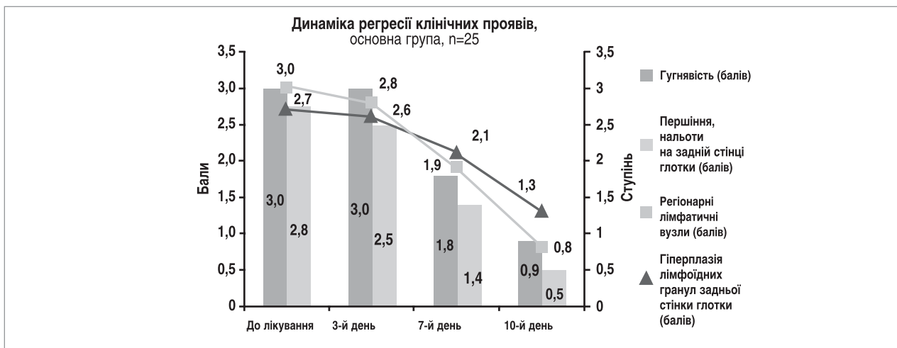
Рис. 1. Динаміка регресії основних клінічних проявів назофарингіту у пацієнтів основної групи

Методом випадкового розподілу хворі були поділені на дві групи. Пацієнти основної групи (n=25) отримували назальний деконгестант, іригаційну терапію (3 р/день), топічний назальний антибіотик, Імупрет у стандартному дозуванні в режимі прийому 6 р/день до зникнення гострої симптоматики з подальшим переходом у режим 4-разового прийому протягом 4 тиж. Учасникам групи порівняння (n=25) призначали назальний деконгестант, іригаційну терапію (3 р/день) і топічний назальний антибіотик.