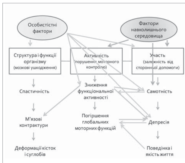
Рис. 3. Приклад взаємопов'язаності складових факторів МКФ

в осіб з усіма видами захворювань або станів, але є досить складним інструментом для використання в повсякденній практиці. Лікарі та інші спеціалісти застосовують лише частину категорій, представлених в МКФ, постала необхідність зловити «момент змін», які відбуваються з пацієнтом під час реабілітації, та порівняння різних методів реабілітації.