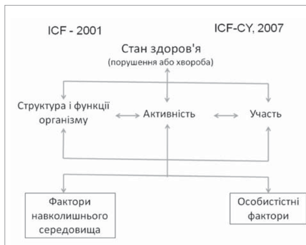
Рис.1. Міжнародна класифікація функціонування, обмеження життєдіяльності та здоров'я (МКФ)

З огляду переважно на етичні норми, які не були враховані в ICIDH по відношенню до осіб з ознаками соціальної недостатності, що в багатьох випадках стало причиною дискримінації інвалідів, у 2001 р. ВООЗ прийняла удосконалену версію класифікації. Вона отримала назву «Міжнародна класифікація функціонування (МКФ), обмежень життєдіяльності і здоров'я» (ICF – International Classification of Functioning, Disability and Health). У 2007 р. була прийнята версія ICF для дітей та підлітків (рис. 1). ICF орієнтована не лише на констатацію тяжкості наслідків захворювань, у ній вперше робиться акцент на адаптивно-компенсаторні можливості організму, важливість максимального залучення інваліда до суспільного життя, та вводиться нове визначення поняття «реабілітаційний підхід до лікування хворого». Основні положення ICF: Impairment – ушкодження, Acti-