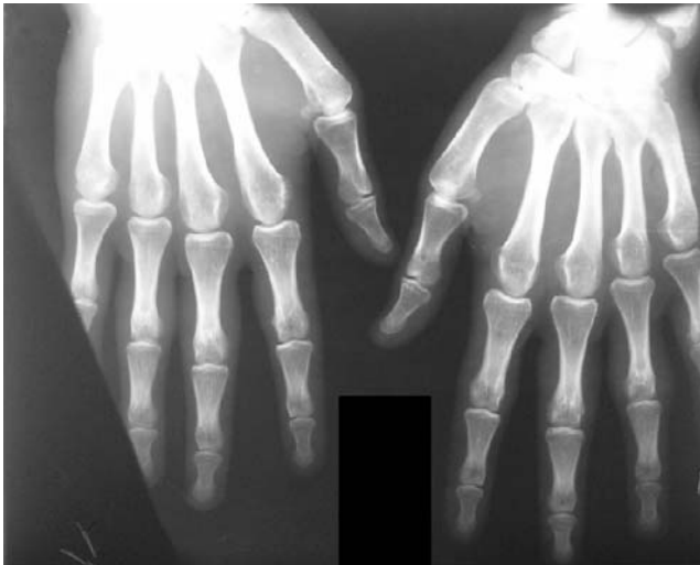
Рис. 6. Рентгенография кистей больного С.: утолщения мягких тканей латеральных поверхностей проксимальных фаланг II–IV пальцев обеих кистей, отсутствие изменений костной ткани предполагаемого ЮРА. Лечения не получал ввиду сомнений в диагнозе.

Анамнез жизни без особенностей. Наследственность не отягощена. Отмечается привычка ребенка переплетать пальцы рук «в замок» с последующим сжатием кистей. При этом максимальное давление приходится на латеральные поверхности проксимальных фаланг. Этим приемом ребенок уменьшает явления стресса.