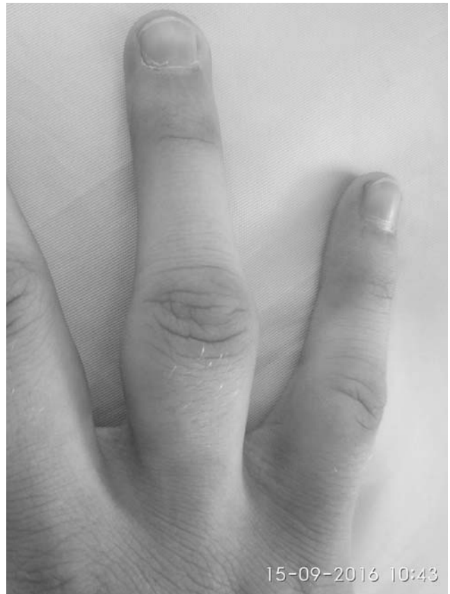
Рис.5. Утолщения мягких тканей латеральных поверхностей проксимальных фаланг III пальца правой кисти больного С.