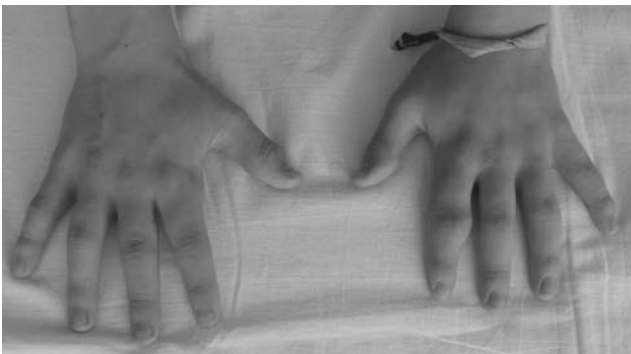
Рис.2. Утолщения мягких тканей вокруг проксимальных межфаланговых суставов I и II пальцев правой кисти и II пальца левой кисти, пястно-фалангового сустава II пальца правой кисти (тыльная поверхность)