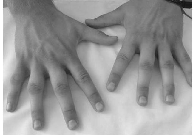
Рис.4. Утолщения мягких тканей латеральных поверхностей проксимальных фаланг II–IV пальцев обеих кистей больного С.