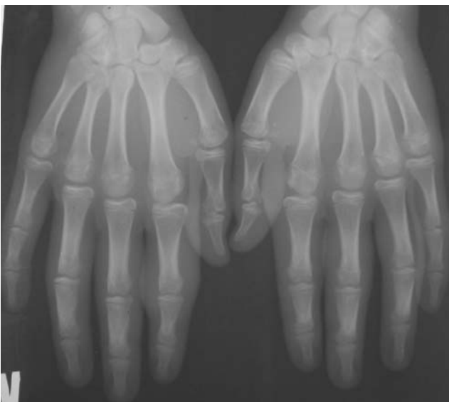
Рис.3. Рентгенография кистей больного В. — отсутствие изменений костной ткани, утолщения мягких тканей вокруг проксимальных межфаланговых суставов I и II пальцев правой кисти и II пальца левой кисти, пястно-фалангового сустава II пальца правой кисти

вокруг проксимальных межфаланговых суставов I и II пальцев правой кисти и II пальца левой кисти, пястно-фалангового сустава II пальца правой кисти (рис. 1, 2).