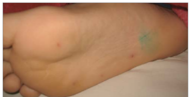
Рис. 5. Екзантема у дитини із синдромом «рука–нога–рот»