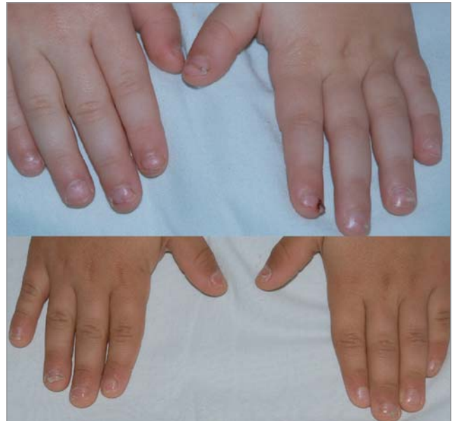
Рис. 12. Множинність ураження нігтів кистей рук

була відзначена тенденція до зміни клінічного перебігу захворювання у дітей регіону.