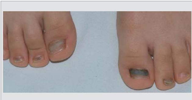
Рис. 9. Деформація нігтьового ложа, потовщення нігтьової пластинки та зміна її забарвлення