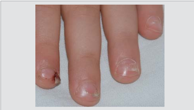
Рис. 8. Різні стадії відшарування нігтьової пластинки кисті у дитини 4 років