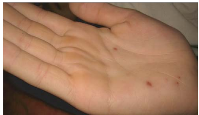
Рис. 4. Екзантема у дитини із синдромом «рука–нога–рот»