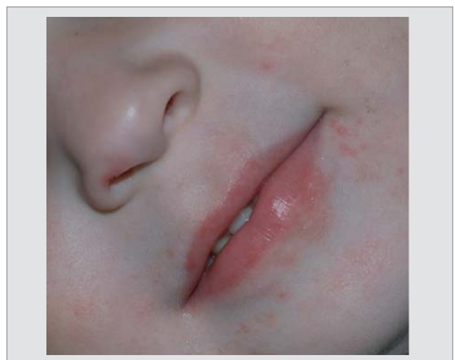
Рис. 6. Висипання на обличчі навколо рта