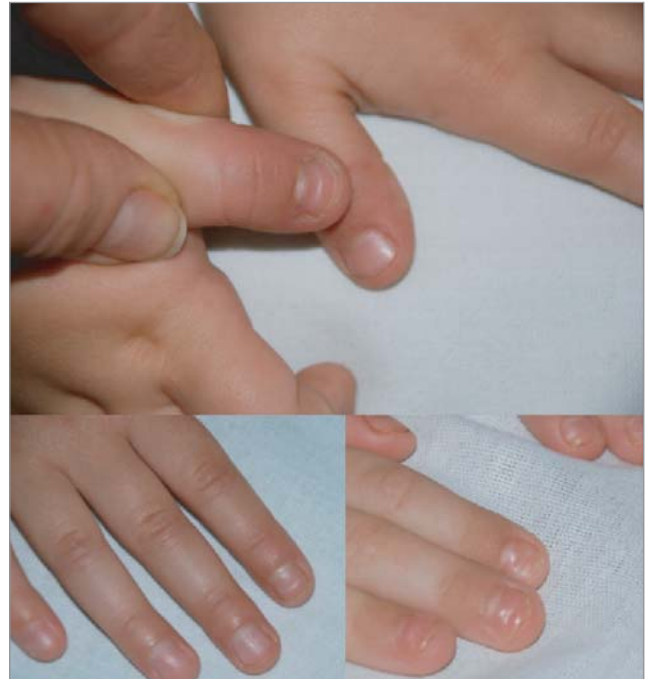
Рис. 11. Beau's lines на великих пальцях долонь та стоп та вказівному пальці правої долоні