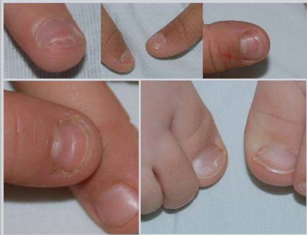
Рис. 7. Строкатість змін нігтьових пластинок у дітей із різними клінічними формами ентеровірусної інфекції