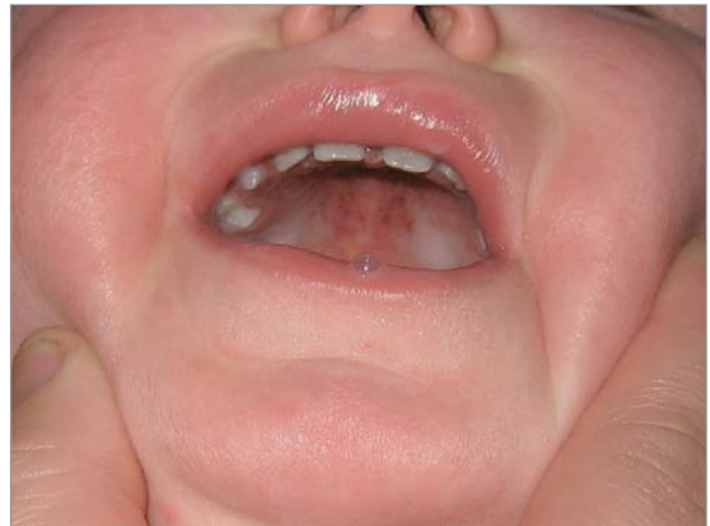
Рис. 3. Енантема у дитини із синдромом «рука–нога–рот»