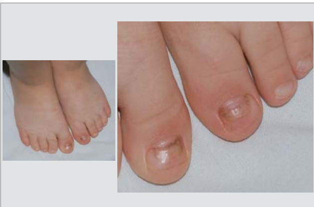
Рис. 10. Лінії Меєсса на великих пальцях стоп