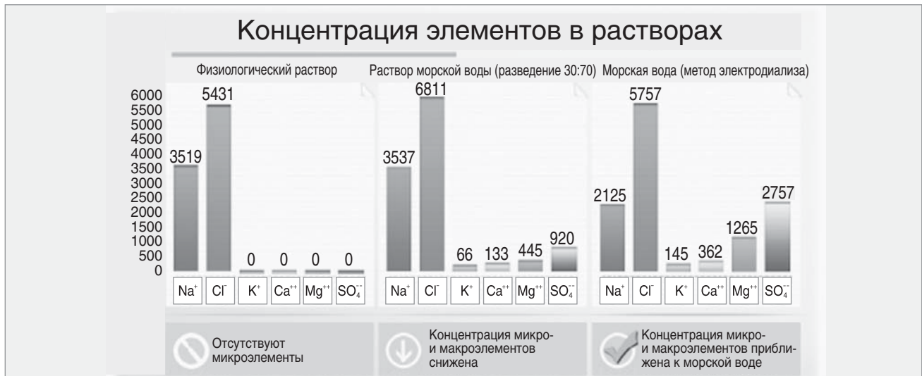
Рис. 2. Хьюмер — 100% неразбавленная морская вода

Содержание хлорида натрия в клетках слизистой оболочки носа составляет 0,9% (изотонический показатель). Осмотический градиент составляет более 0,9%. Гипертонический раствор приводит к увеличению выпота тканевой жидкости в полость носа (противоотечное и муколитическое действие). Изотонический и гипотонический растворы просто увлажняют и очищают слизистую оболочку.