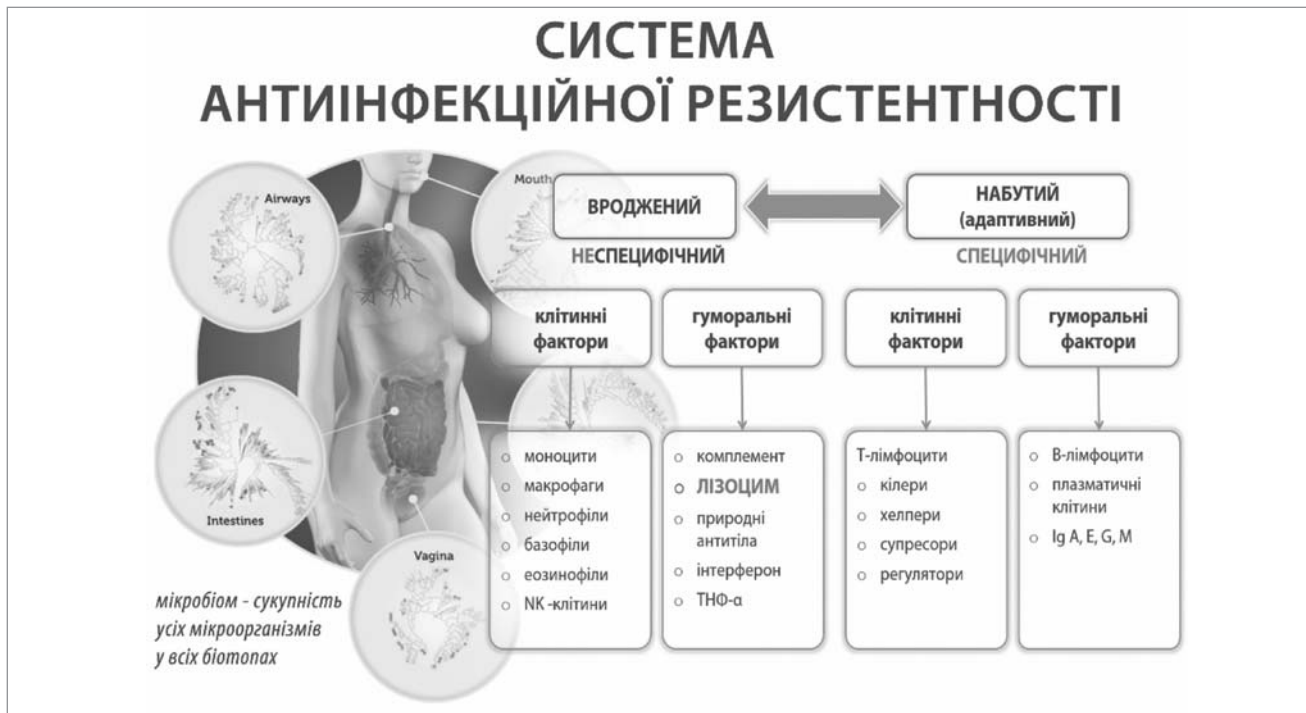
Рис.1. Компоненти системи антиінфекційної резистентності

та специфічні фактори захисту) [5] — лімфоїдні тканини, асоційовані зі СО (mucosa-associated lymphatic tissue — MALT) [10] (рис.1).