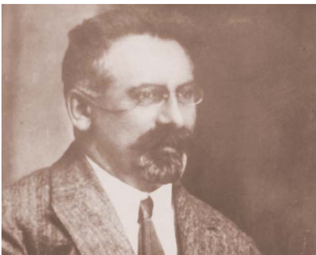
Професор Є. Л. Скловський — завідувач кафедри охорони дитинства з 1918 року по 1930 рік

Професор Скловський Євген Львович після закінчення медичного факультету Київського університету Святого Володимира працював земським лікарем (1892–1896), згодом – співробітником Київського університету Святого Володимира. У 1906 р. він організував у Києві першу в Україні Консультацію для новонароджених, а у 1911 р. – перші дитячі ясла. У 1918–1920 рр. Євген Львович керував відділом охорони материнства та дитинства Київського окружного відділу охорони здоров'я. Напрямами його наукової діяльності були туберкульоз у дітей, дифтерія та інші