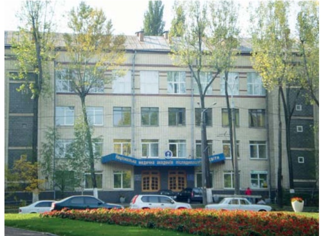
У жовтні 2018 року виповнюється 100 років Національній медичній академії післядипломної освіти імені П.Л. Шупика. Сучасний адміністративний корпус академії

На цей період припадає і відкриття перших кафедр – офтальмології (1918 р., професор М.А. Левитський) і педіатрії (1918 р., професор