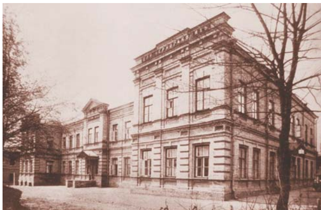
Головний корпус лікарні Інституту охорони материнства і дитинства на 50 ліжок, де з 1929 р. знаходилися обидві педіатричні кафедри, а після їх об'єднання у 1930 р. до 1988 р. (59 років) працювала кафедра педіатрії №1