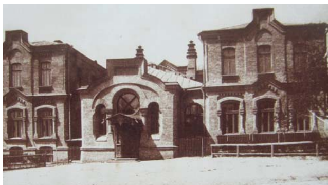
Будинок амбулаторії для чорноробів (1902 р.), де зараз знаходиться управління базової клініки - Національної дитячої спеціалізованої лікарні "ОХМАТДИТ"

У 1930 р. по смерті професора Є.Л. Скловського обидві педіатричні кафедри було об'єднано в кафедру дитячих хвороб, яка в подальшому і стала кафедрою педіатрії №1. Отже, через рік, у березні 2019 р., виповниться 90 років роботи кафедри на базі лікарні, яка за довгий період свого існування мала різні назви і підпорядкування і лише у 1957 р. була реорганізована у власне дитячий лікувальний заклад під назвою «Дитяча спеціалізована клінічна лікарня м. Києва», а у 1996 р. перетворена і перейменована в Українську дитячу спеціалізовану лікарню «ОХМАТДИТ». У 2008 р. закладу присвоєно почесний статус Національної лікарні.