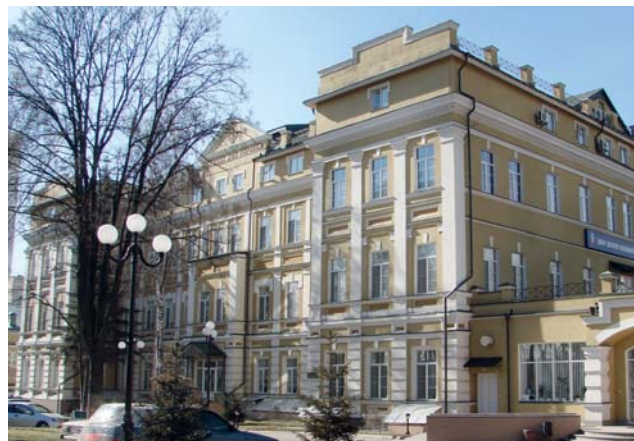
Той же головний корпус лікарні у наш час, в якому зараз знаходиться Науково-практичний центр дитячої кардіології та кардіохірургії МОЗ України

дитячі захворювання, боротьба з дитячою смертністю тощо. Євген Львович був одним із засновників і фундаторів не тільки Київського інституту удосконалення лікарів, але й дитячих лікувально-профілактичних закладів м. Києва, громадського руху «Крапля молока» на користь бідного населення м. Києва.