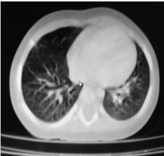
Рис. 3. КТ высокого разрешения с контрастированием ребенка П., 8 мес. При сканировании без задержки дыхания на серии слайдов выявлена полулунная деформация и сужение трахеи и левого главного бронха

пульмональной инфекции. В таблице представлены маркерные признаки мальформаций трахеобронхиального дерева, приводящие к формированию бронхоэктазов (уровень доказательности D), согласно рекомендациям Британского торакального общества [2].