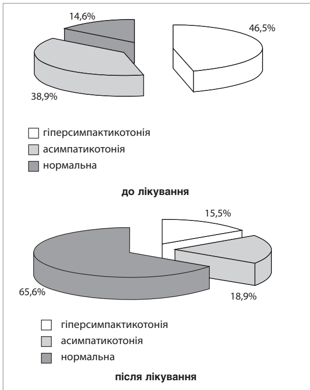
Рис. 2. Показники вегетативної реактивності до і після лікування, %

Деякі особливості виявлені у дітей з вихідною симпатикотонією — незначне превалювання потужності дуже низьких хвиль над потужністю високочастотних і низькочастотних хвиль (табл. 3). Відмічається значне підвищення ІН, а загальна потужність та потужність високочастотних хвиль дещо знижені.