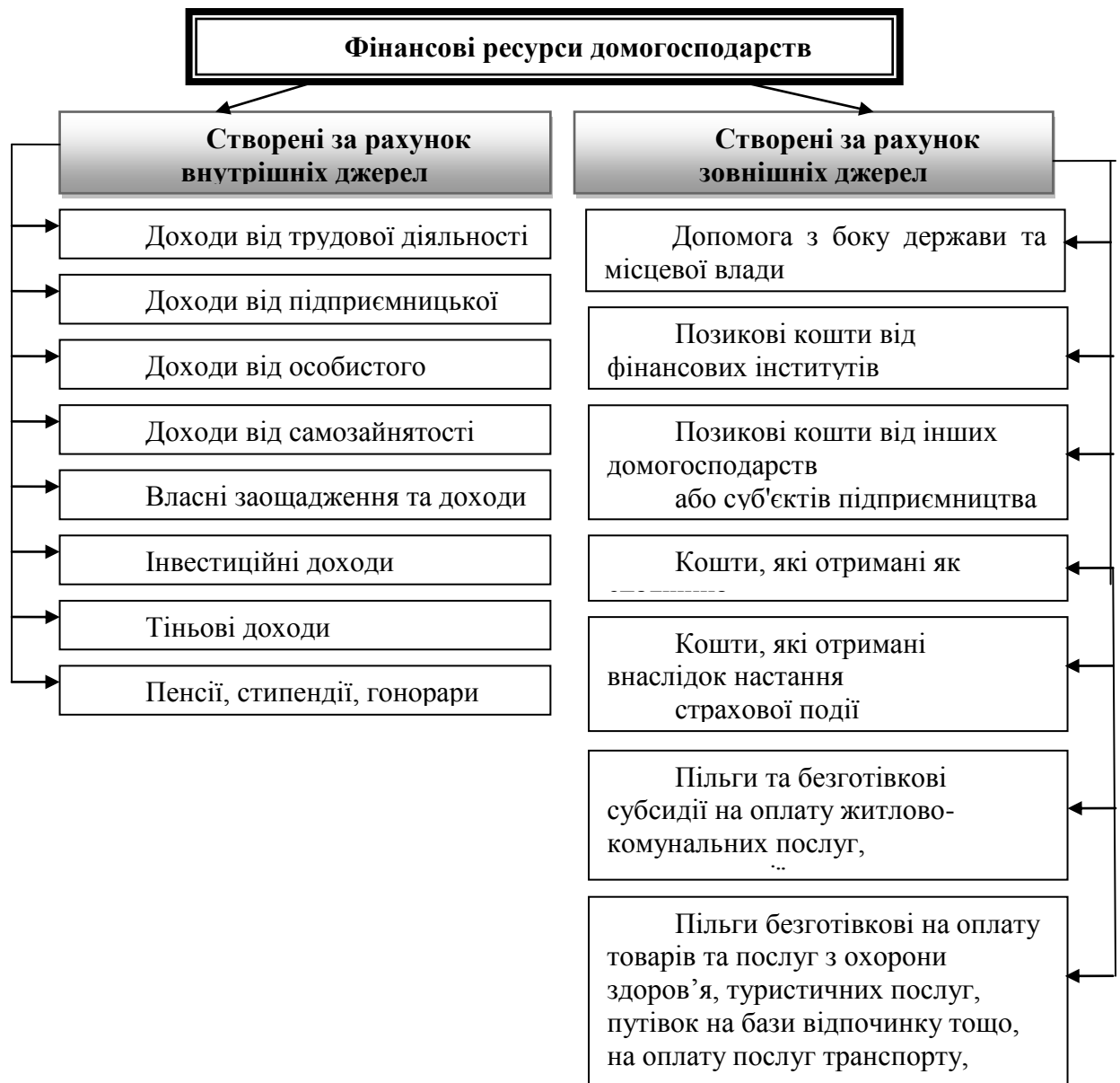
Рис. 1. Джерела формування фінансових ресурсів домогосподарств

дорослих; 5) фонд фінансування щорічного відпочинку; 6) фонд для фінансування ремонтів житла, автомобілів тощо; 7) фонд забезпечення старості; 8) інші фонди домогосподарства.