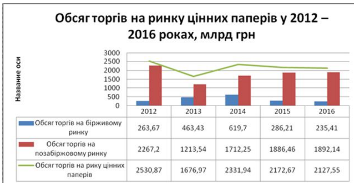
Рис. 2. Обсяг торгів на ринку цінних паперів 2012–2016 роками, млрд грн

Необхідним стає розуміння кількості біржових торгів на фондовому ринку в розрізі всіх торгів, що відбувалися на фондовому ринку. На рис. 2 відображена динаміка торгів на біржовому та позабіржовому фондових ринках протягом 2012–2016 р.