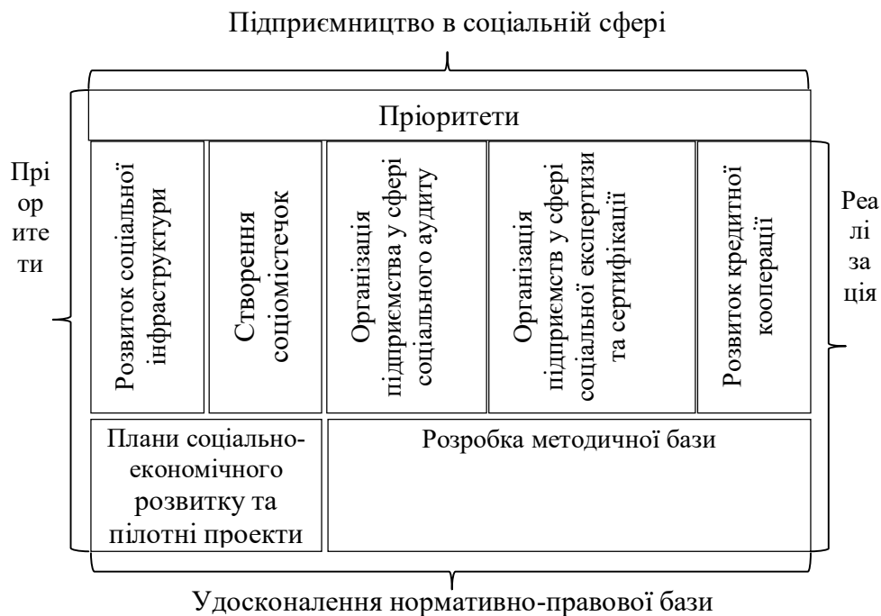
Рис. 3. Пріоритетні напрямки запровадження підприємництва в соціальній сфері

Пріоритетні напрямки запровадження підприємництва в соціальній сфері наведені на рисунку 3.