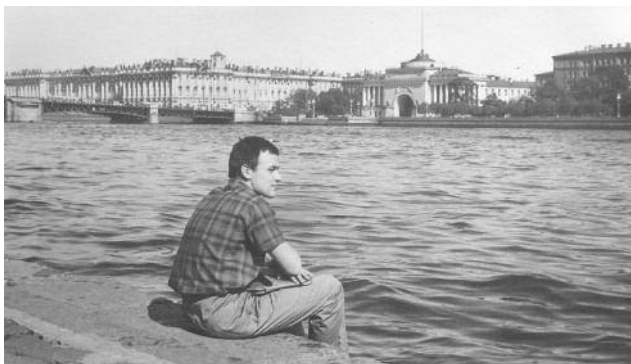
Над Невною: Зимовий палац, адміралтейство, 1964 р.