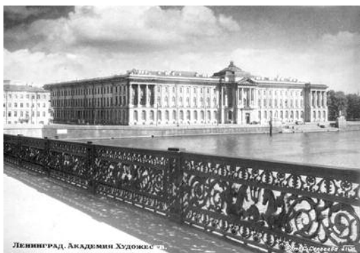
Академія з мосту ім. лейтенанта Шмідта. 1952 р.

но-філософські й історико-політичні теми, серед них і націоналістичні українські початку ХХ ст., що важко було собі увявити у Києві.