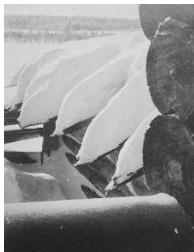
У порожньому селі, покинутому мешканцями. Північ Ленінградської обл., січень 1966 р.

ріалу: пропонував студентові пару підписаних діапозитивів для порівняльної характеристики. Мені дісталися Скляний Палац у Лондоні та Пті Пале в Парижі. Не дуже розуміючи, що спільного у цих двох різнокаліберних об'єктів, я почав із цитування Іоанна Предтечі «Той, котрий іде за мною — попереду мене», адже в хронологічно давнішій лондонській пам'ятці втілено новітніші архітектурні принципи. Далі Пунін не слухав, одразу поставив п'ятірку.