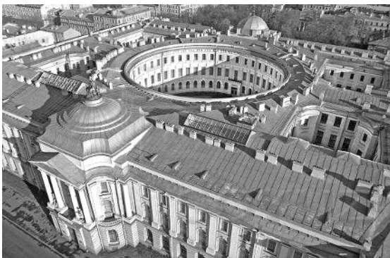
Академія з висоти пташиного польоту