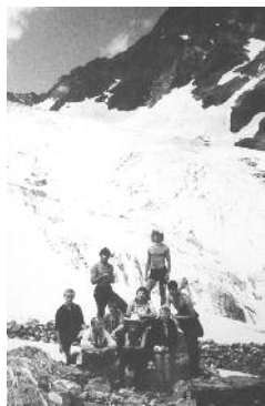
На кавказькому перевалі Кизгич.