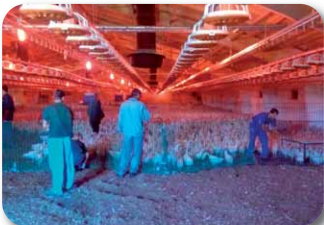
Відловлювання ремонтного молодняку

Останніми роками птахівнича галузь постійно демонструє збільшення виробництва продукції, особливо це стосується виробництва м'яса птиці. Саме птахівнича галузь характеризується широким впровадженням інвестиційних проектів, завдяки чому рівень ведення технологічного процесу в птахівничих господарствах є високим.