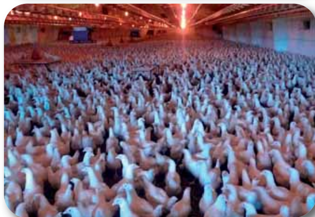
Ремонтний молодняк курей кросу "Ross-308"