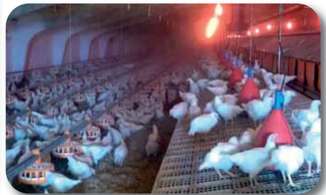
Батьківське стадо курей кросу "Ross-308"

Інкубація яєць є складовою частиною технології виробництва продукції птахівництва. Вона включає