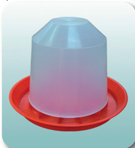
Рис.2. Автоматична напувалка