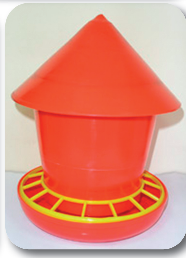
Рис. 3. Автогодівниця для голубів