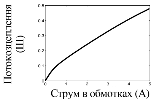
Рисунок 1 – Назва рисунку

МАТЕРІАЛ І РЕЗУЛЬТАТИ ДОСЛІДЖЕНЬ. Рисунки подаються чорно-білими або у відтінках сірого. Вісі на графіках повинні мати пояснювальну назву (рис. 1).