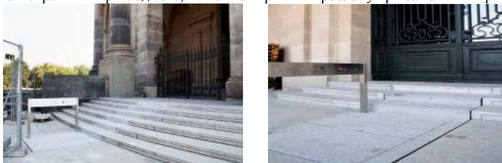
Рисунок 2 – Прихований пандус

Коли споруди є цінною архітектурною пам'яткою і неможливо створювати надбудови, доцільним буде встановлення прихованих пандусів (рис. 2), які донедавна почали використовуватись в Європі. Під гранітним покриттям і ступенями встановлені два прихованих механізми, на поверхні залишається лише невеликий пульт управління. При запуску системи з-під землі піднімається страхувальна огорожа, сходи при цьому перетворюються на рівну площадку-місток. Ще одне натискання - і на місці платформи знову звичайна гранітні сходи. В Україні така практика, звичайно, ще не була помічена в застосуванні, але це найяскравіший приклад того, як можна вирішити проблему при бажанні її вирішувати.