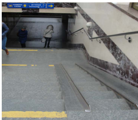
Рисунок 6 – В'їзд до переходу залізничного вокзалу (м. Вінниця)