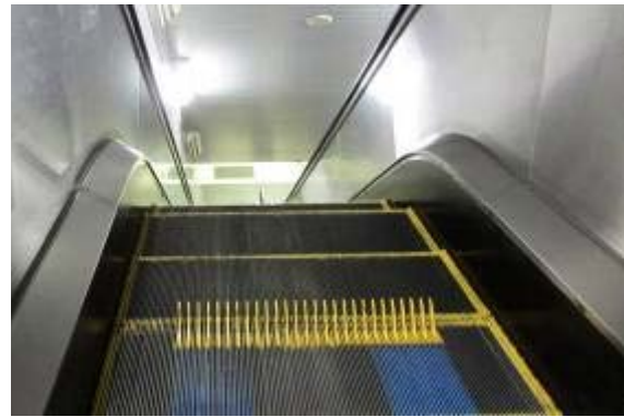
Рисунок 3 – Ескалатори у Токіо

Підйомні платформи (рис.4) є універсальним пристроєм, який можуть використовувати всі групи маломобільних громадян для подолання сходових сходинок, в тому числі навіть молоді мами з колясками. Враховуючи високу вантажопідйомність такої підйомної платформи, практично не виникає ніяких технічних труднощів при використанні даного похилого підйомника для інвалідів [5].