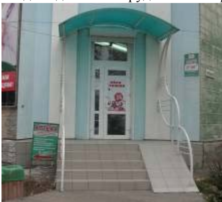
Рисунок 11 – Аптека