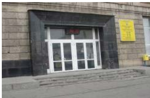
Рисунок 8 – Поштове відділення №50

До закладів періодичного відвідування також відносяться поштові відділення та відділення зв'язку. До прикладу було обрано відділення № 50 (рис. 8) за адресою Соборна 8 та будівлю Укртелекому (рис. 9) за адресою проспект Коцюбинського, 28 тому, що вони розташовані в центральній частині міста, і відіграють важливу роль в обслуговуванні великої частини населення. В загальному їхня доступність оцінюється посередньо. Тротуарна частина перед входом до будівель знаходиться в пошкодженому стані, що ускладнює доступ до будівлі. У самій споруді пошти відсутні будь-які допоміжні засоби підйому для МГН (перила, пандуси, кнопки виклику та ін.). Біля будівлі Укртелекому теж відсутні пандуси та кнопки виклику, а також висота сходинок є різною за величиною і перевищує 0,15 м, що суперечить ДБН В.2.2-17:2006. Рекомендується влаштування поручнів, кнопок виклику та пандусів.