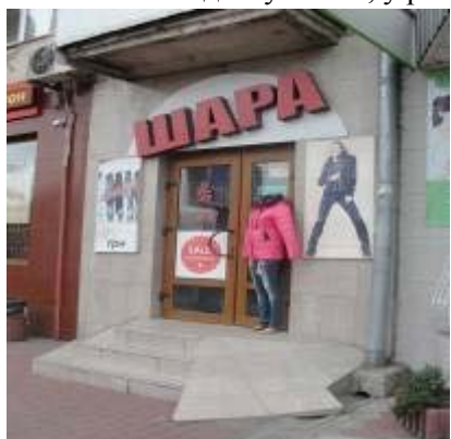
Рисунок 10 – Магазин одягу

Для прикладу було досліджено магазини (рис. 10), з них у 80 % випадків були відсутні будь-які допоміжні засоби доступності, у решті досліджених споруд виявлені проблеми.