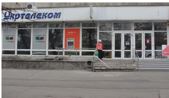
Рисунок 9 – Будівля Укртелекому

До об'єктів з повсякденним обслуговування належать установи і підприємства, якими населення користується щоденно. До них відносяться магазини, дитячі ясла і садки, школи, продовольчі й промтоварні магазини, їдальні, кафе, аптеки, ательє побутового обслуговування (ремонтні майстерні, приймальні пункти).