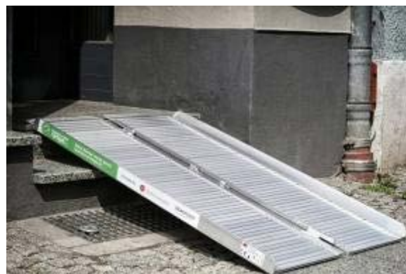
Рисунок 1 – Складні рампи

Уявлення про безбар'єрність міста зазвичай зводять до формули «пандус, щоб подолати кілька сходинок, ліфт, щоб спуститися в метро, і відкидна платформа в автобусах». Це очевидні і правильні рішення, які працюють у багатьох країнах вже не перший рік. В багатьох спорудах громадського користування є принаймні одна - дві невеликих сходинок, це є непомітним для більшості жителів, але представляє труднощі для МГН. При цьому через вузькість вулиць установка пандусів в більшості випадків неможлива. Тому одним із сучасних методів забезпечення доступності є складні рампи (рис. 1).