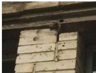
Рисунок 6 – Самочинне будівництво і порушення ДБН