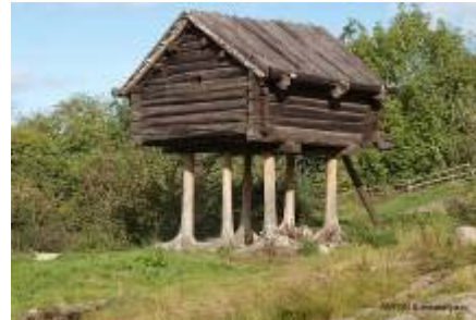
Рисунок 1 – а) Гаражі; б) Сарай.