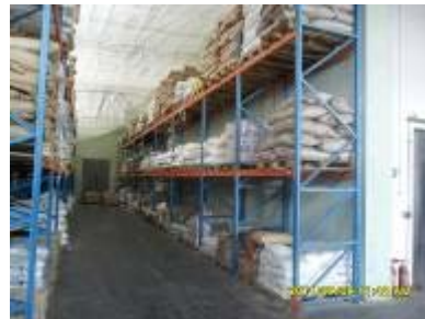
Рисунок 2 – а) Індивідуальний житловий будинок ; б) Склад.