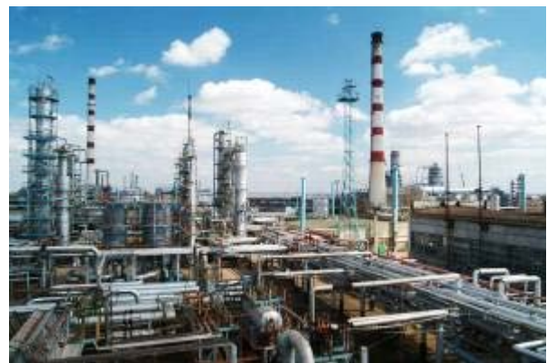
Рисунок 5 – а) Пам'ятки архітектури; б) Великий завод