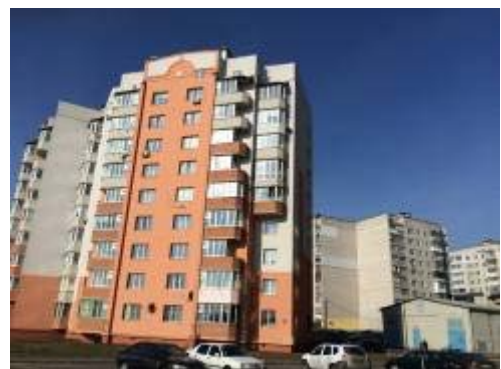
Рисунок 10 – Приклади самочинного переобладнання технічного поверху

6. Порушення ведення журналів виконання будівельних робіт