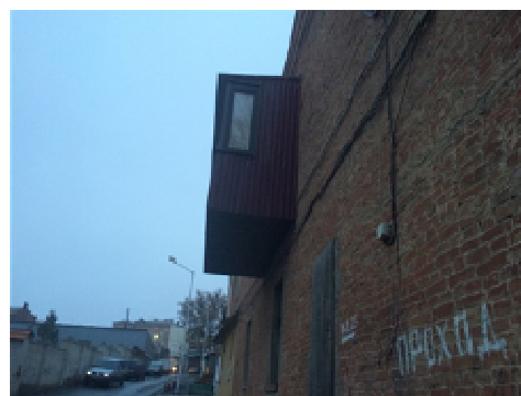
Рисунок 8 – Влаштування балкону без дозвільної документації