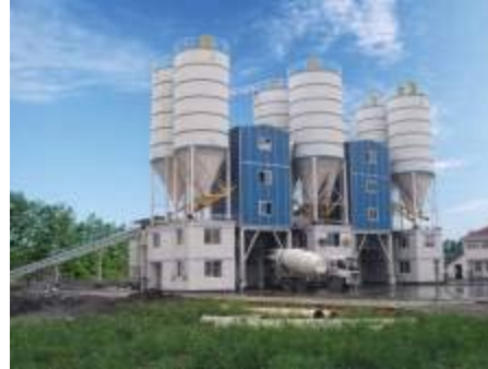
Рисунок 4 – а) Група багатоповерхівок; б) Завод