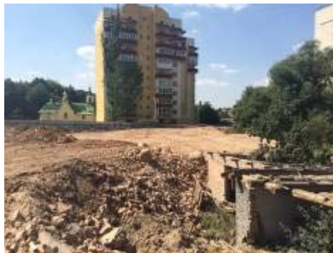
Рисунок 7 – Підготовчі земляні роботи

3. Самочинне переобладнання балкону в центральному районі Вінниці[3]