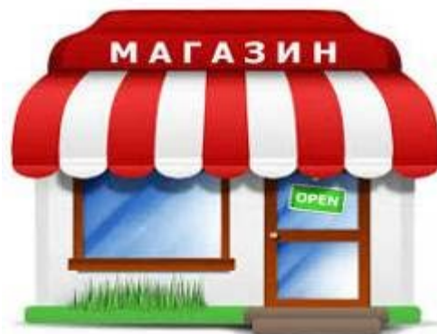
Рисунок 3 – а) 9-ти поверховий будинок(1-2 під'їзди); б) Магазин.