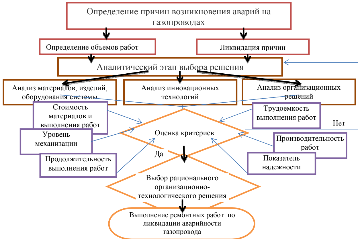
Рисунок 2 – Блок-схема выбора рационального организационно-технологического решения ремонта или замены участка газопровода

Первый этап заключается в анализе основных причин возникновения аварий на газопроводах, который приведен в таблице 1.