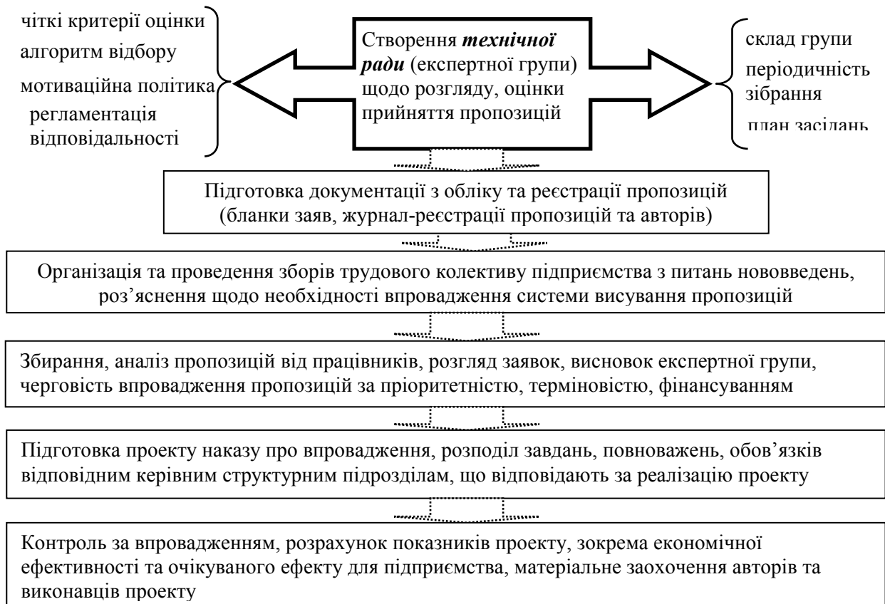
Рисунок 3 – Організаційна схема впровадження системи висування пропозицій на підприємстві (розроблено авторами)

На існуючих підприємствах практика висування та впровадження раціоналізаторських пропозицій досі приносить значний дохід. Масовим це явище сьогодні назвати неможливо, проте наявні поодинокі випадки, неодноразово підтверджували ефективність даного методу стимулювання творчої активності трудових ресурсів.