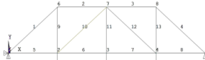
Рисунок 1 – Вихідна схема ферми

Для виконання топологічної оптимізації створюємо плоский прямокутний фрагмент одиначної товщини, який має розміри габаритів ферми 16*3 м, встановлюємо в'язі і завантажуюмо його заданим навантаженням (рис. 2а).