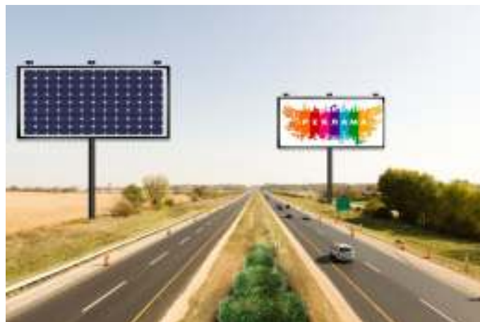
Рисунок 5 – Розташування біг-бордів біля траси

Даний спосіб розташування ефективний, тому що розміри, та відповідно, площа біг-борда за