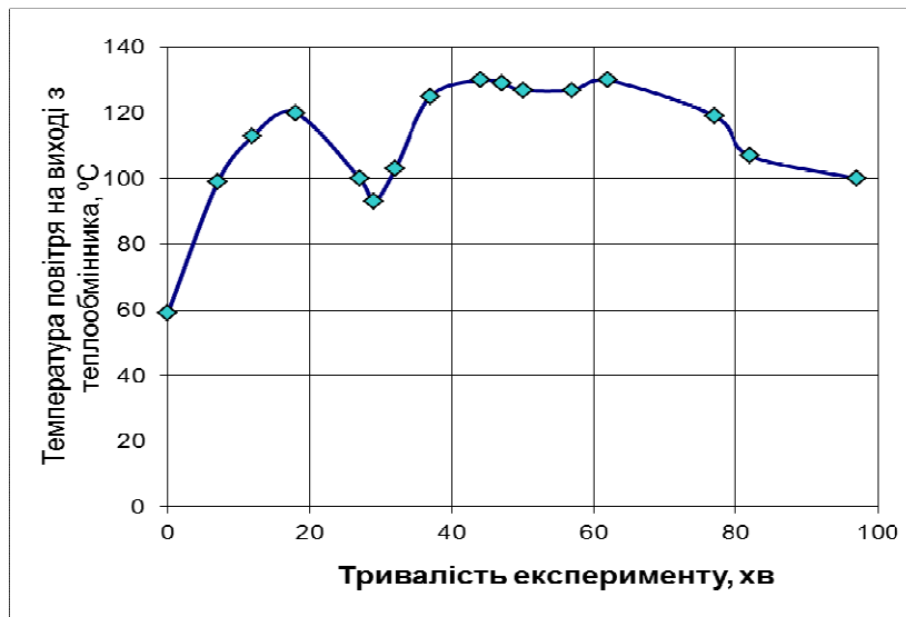
Рисунок 1 – Зміна температур повітря на протязі експерименту при запуску котла з холодного стану

На рисунку 1 показано зміну температури повітря на виході з теплообмінника при запуску котла з холодного стану. Заміри проведено через 10 хвилин після початку експерименту. Через 30 хв повітря прогрілось до 120 °С. Після різкого зниження температури до 93 °С, було запалено солому в другій топці. Експеримент розпочато о 15 год 8 хв, о 17 год солома в обох топках вигоріла.