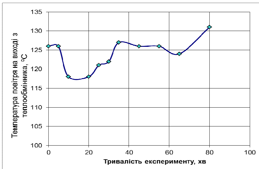
Рисунок 2 – Зміна температур повітря на протязі експерименту в умовах сталого безперервного горіння