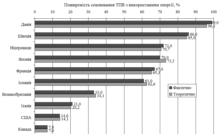
Рисунок 1 – Порівняння фактичної та теоретичної поширеності спалювання ТПВ з утилізацією енергії

З рис. 1 видно, що теоретична поширеність спалювання ТПВ з утилізацією енергії, розрахована за допомогою регресійної моделі (1), несуттєво відрізняється від фактичних даних, що підтверджує визначену раніше достатню достовірність отриманої залежності, яка може бути використана під час розробки стратегії, комплексу машин та обладнання для поводження з ТПВ.