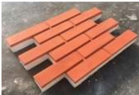
Рисунок 2 – Загальний вигляд фасадних термопанелей.

Покращена конструкція термопанелі додатково включає шип-паз по периметру, призначений для виключення виникнення містків холоду при монтажі термопанелей. Основними перевагами є: ефективна теплоізоляція, екологічність, не піддаються корозії та впливу різних мікробів, відносять до класу важкозаймистих матеріалів, мають хороші звукоізоляційні характеристики, мають тривалий термін експлуатації. Використовуються для утеплення фасадів, стіни з фасадними термопанелями ефективніше зберігають тепло, ніж стіни, зведені за іншими традиційними технологіями [2].