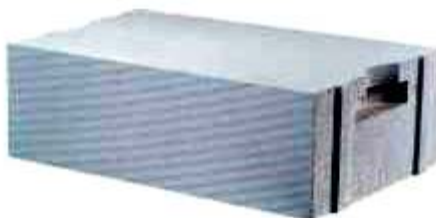
Рисунок 3 – Загальний вигляд блоку YTONG ENERGO

Енергозберігаючі стінові блоки – несучий і самонесучий будівельний матеріал, який використовується для зведення несучих стін (у будинках з висотністю не більше трьох поверхів). На даний час нараховується багато видів енергоефективних блоків з різних матеріалів та з різною структурою та особливостями. Найпоширенішими є: блоки YTONG ENERGO - це теплий і одночасно міцний сорт пористого бетону PP2 / 0,35, структура якого, являє собою мільйони маленьких шпаринок, що в свою чергу робить найтеплішим з усіх доступних на ринку конструкційних матеріалів, призначених для будівництва будинків. Вони відповідають найвищим технічним нормам, характеризуються довшим часом, що затрачається на охолодження, та добре нівелюють зовнішні коливання температур, мають унікальну термоізоляція, пожежостійкість та сейсмічну витривалість [3].