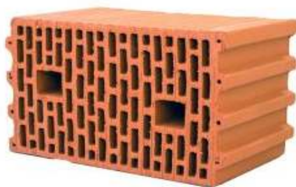
Рисунок 4 – Загальний вигляд керамічних термоблоків

Багатошарові блоки виготовляються методом лиття. Блоки виконуються тришаровими - зовнішній і внутрішній основні шари блоку з'єднуються металевими або склопластиковими арматурами. Середній шар – термовкладиш з пінополістиролу. Внутрішній основний шар має гладку лицьову поверхню і підходить для стін призначених під суцільну шпаклівку.