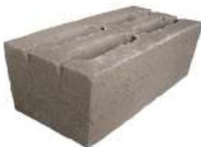
Рисунок 8 – Загальний вигляд тирсоблоку

Тирсобетон – це конструктивно-теплоізоляційний легкий бетон, де в якості заповнювача використовуються тирса і пісок, а в якості в'язучого - цемент та вапно. Це досить міцний матеріал, з якого можна зводити будинки заввишки до 3-х поверхів при товщині стін у 30 см. До переваг тирсобетона можна віднести: високу теплоємність; стійкість до гниття; прекрасні звукоізоляційні характеристики; морозостійкість; стійкість до зараження грибком і мікроорганізмами; слабку горючість. Основним недоліком опілкобетона є висока гігроскопічність.