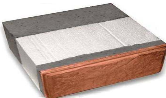
Рисунок 5 – Загальний вигляд тепло блоку.

Вони відповідають найжорсткішим вимогам по екологічності, вогнестійкості, теплозбереженні та довговічності.