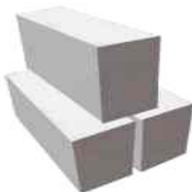
Рисунок 6 – Загальний вигляд піно блоку

Піноблоки – будівельний матеріал, які виробляються з різновиду ніздрюватого бетону – пінобетону. Енергозберігаючі будівельні піноблоки використовуються для захисту стін будівель і приміщень від вологи, перепадів температур та проникаючої радіації. Енергозберігаючі будівельні піноблоки не мають шкідливих речовин, так як виготовляються виключно з біологічно чистих матеріалів. Перевагами піно блоків є: хороша звукоізоляція, стійкість до перепадів температури та екологічність [3].