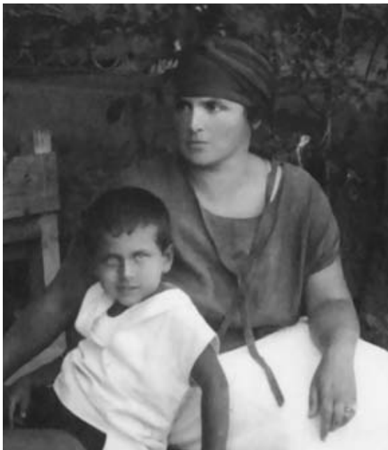
Віра Мухіна із сином. 1924 р.