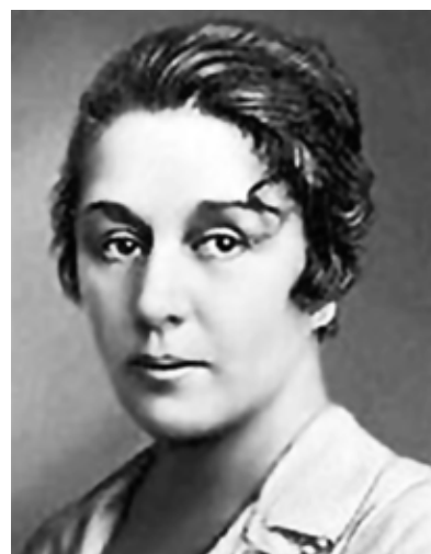
Марія Андреева. 1920-ті рр.