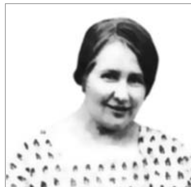
Віра Болсунова. 1920-ті рр.