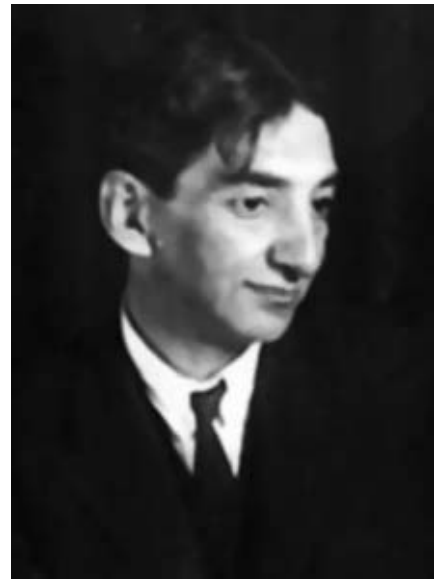
Георгій Якулов. 1920-ті рр.