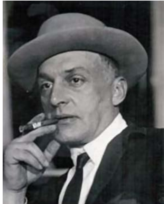
Вадим Меллер. 1920-ті рр.