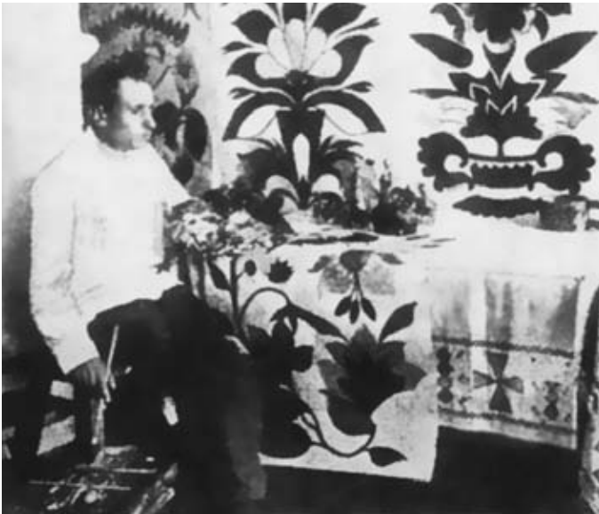
Євмен Пшеченко. 1910-ті рр.