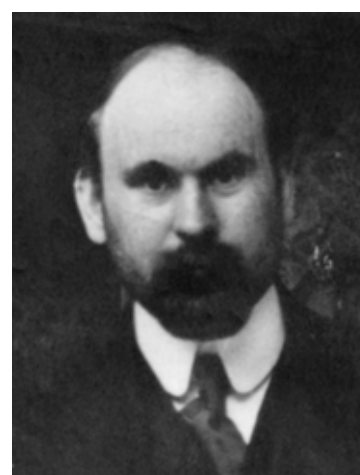
Володимир Черченко. 1920-ті рр.