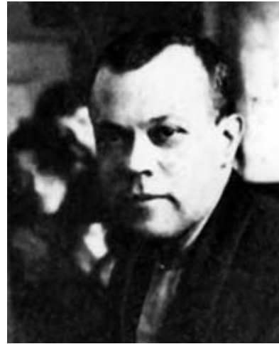
Гнат Нивинський. 1930-ті рр.