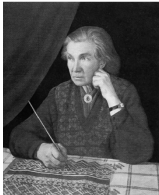
Маргарита Гумільовська. 1950-ті рр.