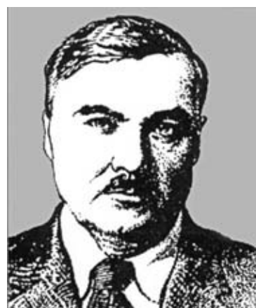
Дмитро Дяченко. Гравійовано з фотографії 1930-х рр.