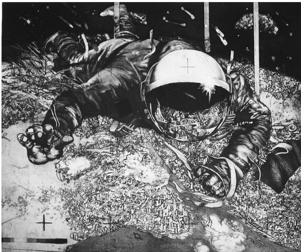
«Каїн» (із серії «Увага – Космос»). 1986 р. Папір, офорт, акватинта