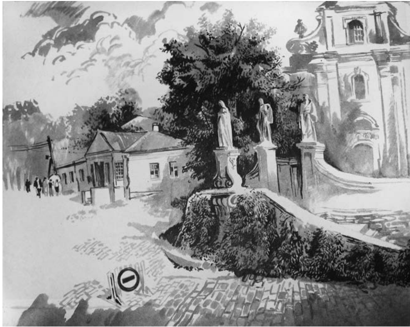
«Костел» (із серії «Літо в Кам'янці-Подільському»). 1983 р. Папір, брунатна і чорна туш, пензель