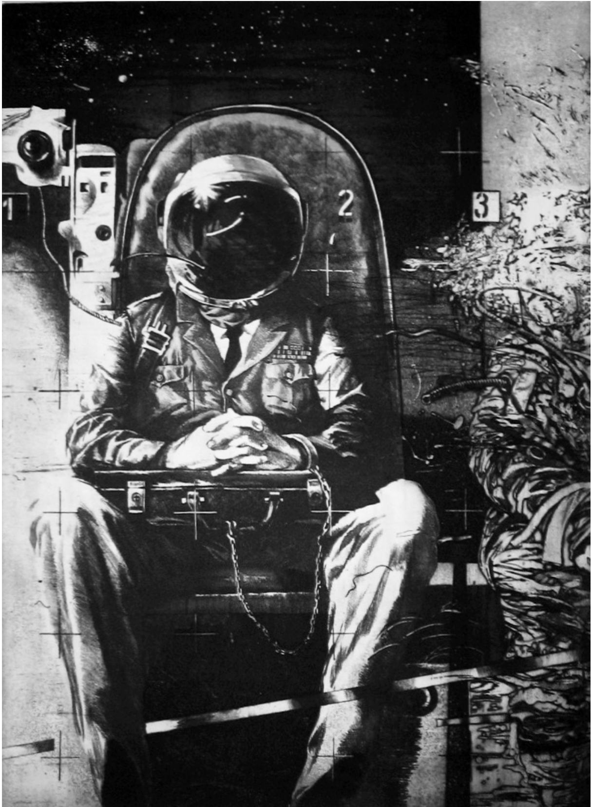
«Таємниця» (із серії «Увага – Космос»). 1986 р. Папір, офорт, акватинта