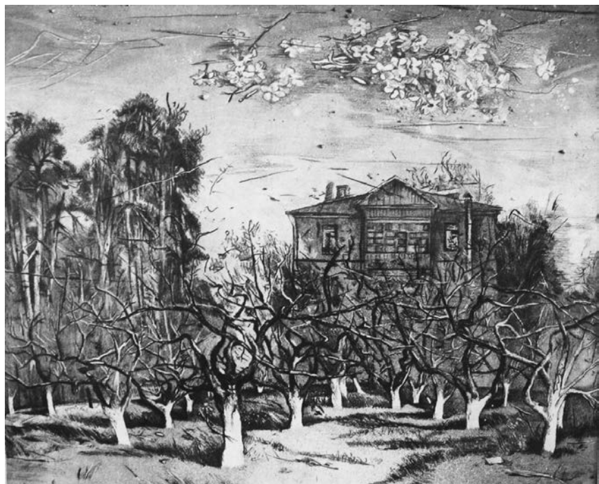
«Сутінки» (із серії «Сад на вул. Сошенка, 33»). 1985 р. Папір, м'який лак, акватинта