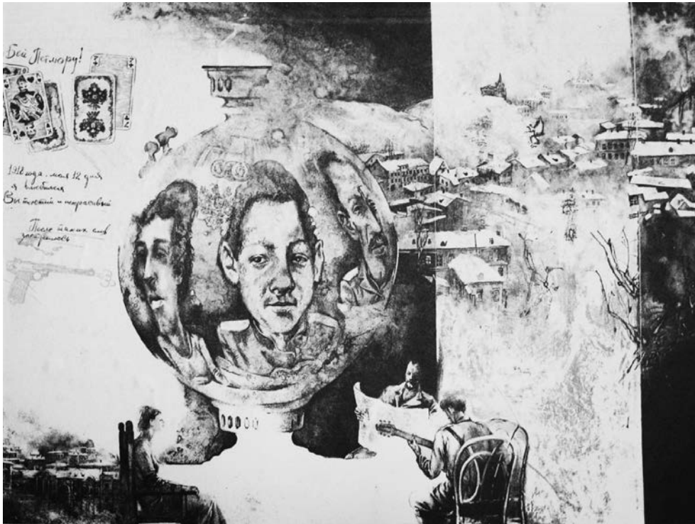
«Страх» (ілюстрація до роману М. Булгакова «Біла гвардія»). 1984 р. Папір, кольорова літографія