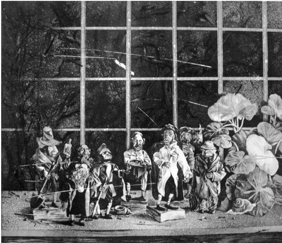
«Ляльки Ігоря» (із серії «Сад на вул. Сошенка, 33»). 1985 р. Папір, м'який лак, акватинта