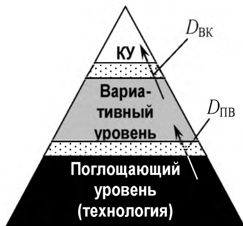
Рисунок 4 – Диффузионные слои между уровнями возможностей команды проекта

нестабильность среды проекта, нацеленность действующей нормативной базы на повышение уровня унификации технических и технологических решений и многое другое.