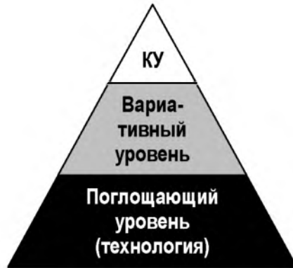
Рисунок 1 – Уровни возможностей команды проекта

К сожалению, если каждый серийный проект является лишь звеном в цепи однотипных, при каждом переходе от проекта к проекту вариативный и, особенно, креативный уровни постепенно замещаются поглощающим так, что, начиная с некоторого момента остается «чистая» технология, проект как бы трансформируется в операционную деятельность – проект перестает быть уникальным и задачи творческого управления проектом сводятся к нулю (рис. 2).