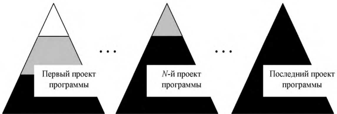
Рисунок 2 – Процесс накопления доли операционной деятельности при выполнении программы, состоящей из серийных проектов

Например, если речь идет о строительстве, управление первым проектом на стадии инициации может включать исследование и выбор метода подъема строительных конструкций и материалов на верхние этажи на креативном уровне и выбор конкретного подъемного устройства на вариативном. На последующих же проектах подъемное устройство