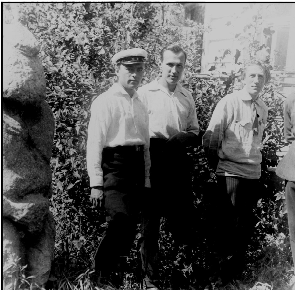
Співробітники Роменського окружно музею

Незважаючи на складну політичну і соціально-економічну ситуацію в країні, питання охорони пам'яток історії та культури не залишилися поза увагою як центральних, так і місцевих органів влади. Вже у лютому 1919 р. з метою збереження історичних і художніх цінностей при Народному комісаріаті освіти (Наркомосвіти) УСРР було створено Всеукраїнський комітет охорони пам'яток мистецтва і старовини (ВУКОПМИС), а вже 1.IV.1919 р. було підписано декрет Раднаркому УСРР, відповідно до якого всі цінності на території республіки передавалися у відання Наркомосвіти, що по суті означало їх державну охорону. Весною 1919 р. з ініціативи місцевих наукових товариств відповідні державні пам'яткоохоронні органи були створені в більшості губерній УСРР.