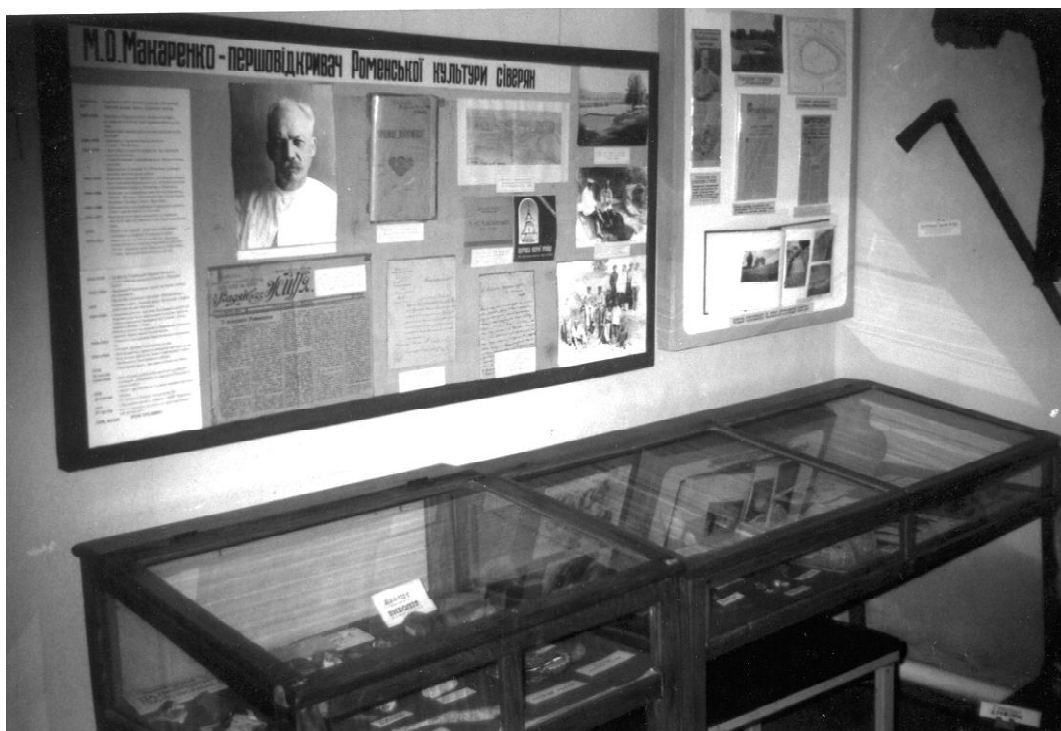
Фрагмент експозиції Роменського краєзнавчого музею

Тож, постало питання пошуку матеріальних ресурсів. У 1924 р. М.О. Макаренко прочитав у Ромнах лекції, зокрема “Прошлоє України в ее раскопках” та “Єгипетські роскопки” , кошти від яких пішли на потреби музею як “комерційні” [18, с. 155]. Запозичивши цей досвід, М.М.Семенчик організував численні виступи та лекції на підприємствах і в навчальних закладах Роменщини, в яких він та його колеги розповідали про історію краю та дослідження останніх років, а також проводили комерційні екскурсії. Як правило, виступи супроводжувалися фотографіями, зробленими власноруч, а також документами з фондів музею. Така діяльність давала змогу частково вирішити фінансову проблему: невеликі, але відносно регулярні надходження підтримували функціонування установи.