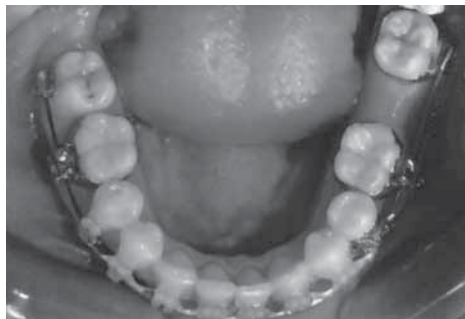
Ситуация через 6 мес