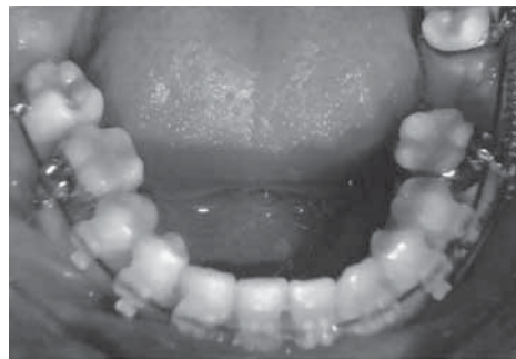
Аппарат для контурирования зубной дуги и для мезиализации