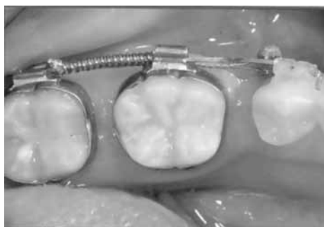
Ситуация через 3 мес