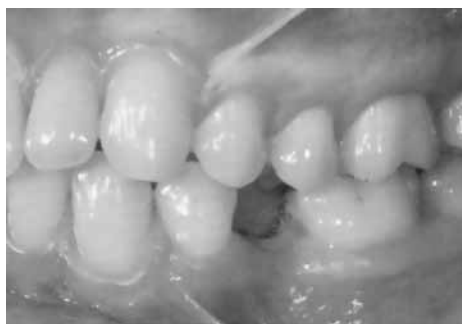
Клиническая ситуация на нижней челюсти