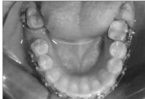
Исходная ситуация на нижней челюсти