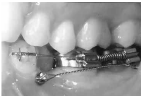
Аппарат для мезиализации 36