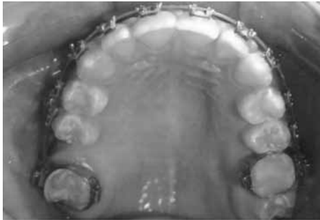
Исходная ситуация на верхней челюсти