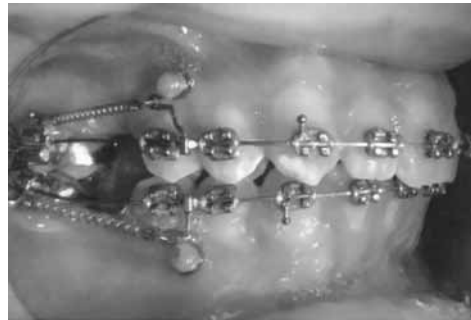
Аппарат для мезиализации