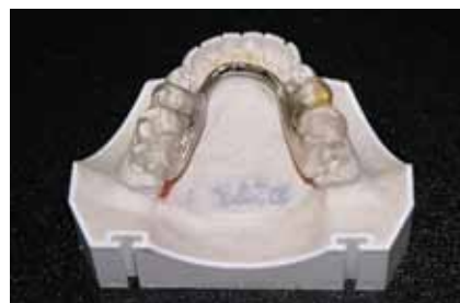
Рис. 10. Готовый аппарат