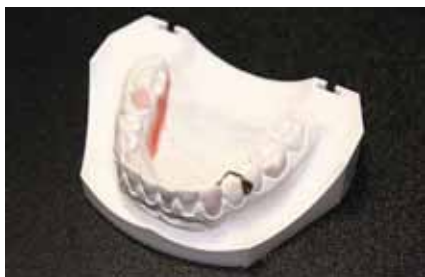
Рис. 3. Изготовление проволочных элементов аппарата