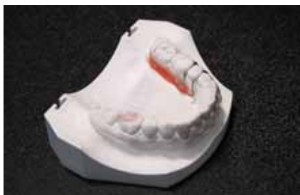
Рис. 4. Изготовление проволочных элементов аппарата