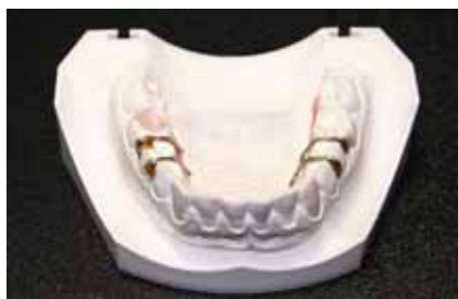
Рис. 5. Изготовление проволочных элементов аппарата