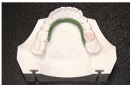
Рис. 2. Изготовление восковой репродукции литой язычной дуги