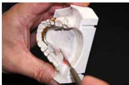
Рис. 6. Нанесение пластмассы