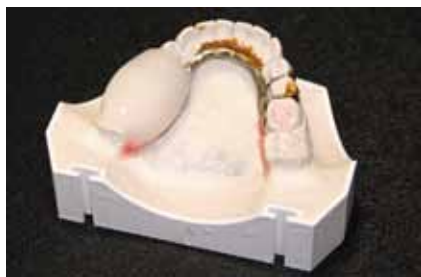
Рис. 7. Нанесение пластмассы