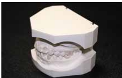
Рис. 1. Модель челюстей

Предлагаем Вашему вниманию рассмотреть этапы изготовления аппарата Gelb, используемого для репозиции челюстей и обеспечения нейро-мышечного баланса. В литературе можно встретить название — MORA (Mandibular Orthopedic Repositioning Appliance). Аппарат используется на нижней челюсти, включает в себя накусочные акриловые пластинки, покрывающие премоляры и моляры, литой язычной дуги и пуговчатых кламмеров.