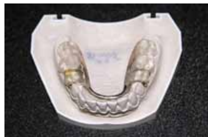
Рис. 11. Готовый аппарат