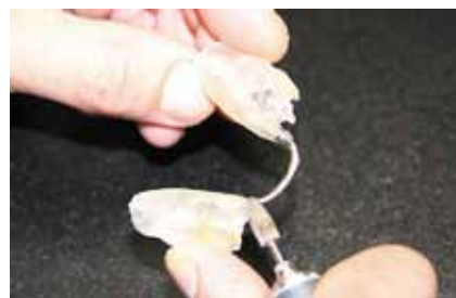
Рис. 9. Обработка аппарата после полимеризации пластмассы