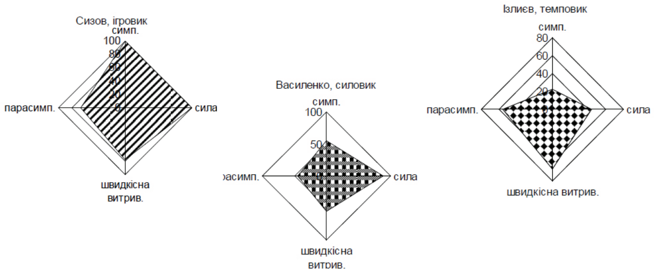
Рис. 2. Приклади індивідуальної вираженості факторів у дзюдоїстів з різними тактичними манерами ведення сутички

тивної нервової системи і помірно виражений другий фактор (рис. 1, 2).