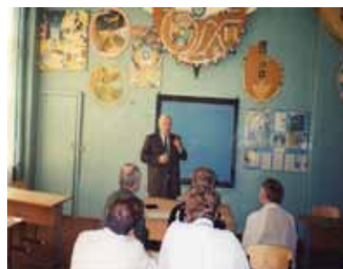
Лекція проф. Сергієнка Л.П. перед викладачами факультету фізичного виховання Слов'янського державного педагогічного інституту (2005 р.)

В останнє ми зустрічались з моїм наставником у 2007 році, коли я, разом зі студентами брав участь у предметній республіканській олімпіаді з «Олімпійського і професійного спорту», а він перебував у спецраді Харківської державної академії фізичної культури. Ми довго спілкувались і він, як і завжди, переймався моєю долею, науковими та професійними досягненнями. Із того часу, і до останнього ми спілкувались лише у телефонному режимі. Завжди вітав його і родину з Новим роком та з нагоди різних свят, а також щодо деяких інших питань. У цей період ми разом із Л. П. Сергієнко випустили методичні рекомендації з курсу «ТМФВ для студентів», він був рецензентом програм, кафедрального посібника. Леонід Прокопович завжди регулярно презентував свої опубліковані наукові роботи, посібники. Він морально підтримував нас у складний для слов'янців час (2014 р.).