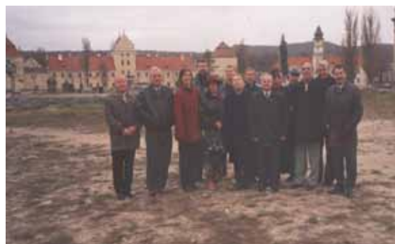
Екскурсія до м. Жовква Львівської області учасників Республіканського семінару завідувачів кафедр ТМФВ і деканів факультетів фізичного виховання (2004 р.)

державного педагогічного інституту. Лекції професора справили надзвичайне враження на слухачів.