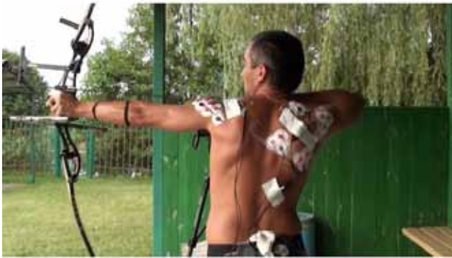
Рис. 1. Електроміографічні дослідження м'язів лучника, задіяних під час стрілецької вправи з синхронною відеофіксацією техніки її виконання.

3. Синхронна реєстрація декількох фізіологічних (пульс, частота дихання, електрична активність діючих м'язів та ін.) та біомеханічних показників спортсменів в on-line режимі (система відеофіксації та ін.) для об'єктивної оцінки функціонального стану спортсмена в тренувальному процесі та відповідно до цього досягнутого ним результату (рис.1).