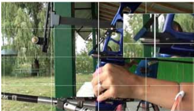
Рис. 4. Прецизійний контроль технічних елементів виконання пострілу – «падіння клікера» та робота лівої руки під час виконання пострілу.

Для спортсменів дуже корисно переглядати зйомки з їхньою участю зразу ж по завершенні ви-