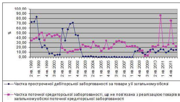
Рис. 2. Динаміка якісних показників поточної дебіторської та кредиторської заборгованості молокопереробних та дистрибуторських підприємств Дніпропетровської області

Щодо такого якісного показника, як частка вексельних розрахунків в загальному обсязі продажів товару (у нашому випадку розраховувалась частка поточної заборгованості за векселями у загальній дебіторській заборгованості за реалізовані товари), то проведенне дослідження не виявило кореляції з коливаннями частки прострочених боргів. Більш того, на підприємствах Дніпропетровської області спостерігається наявність незначної частки вексельних розрахунків в загальному обсязі товарно-реалізаційних операцій, яка у певні, відносно тривалі періоди, навіть дорівнює нулю. Активність процесу отримання векселів спостерігається на початку 2000 р. (частка у товарній дебіторській заборгованості дорівнює від 1,7 % до 4,5 %), у третьому та четвертому кварталі 2004 р. (від 2,8 % до 4 %), в кінці 2007 р. — на початку 2008 р. (3,3–3,6 %).