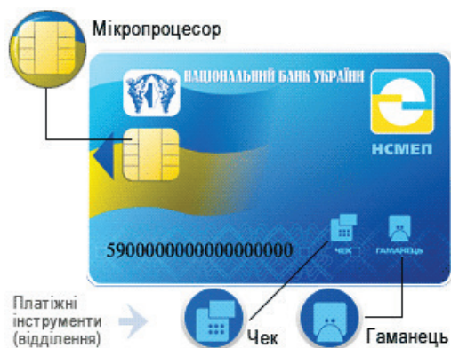
Рис. 2. Смарт-картка НСМЕП

Носієм інформації в системі є смарт-картка, яка на відміну від картки з магнітною смугою, найбільш повно задовольняє вимоги безпеки (рис. 2).