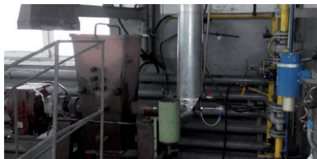
Рис. 3. Внешний вид спекательной установки

Спекание проводилось для слоя шихты высотой 500 мм. Содержание топлива в загружаемой шихте колебалось в диапазоне 3,6–3,4 %. Температура зажигания 1200–1240 °С.