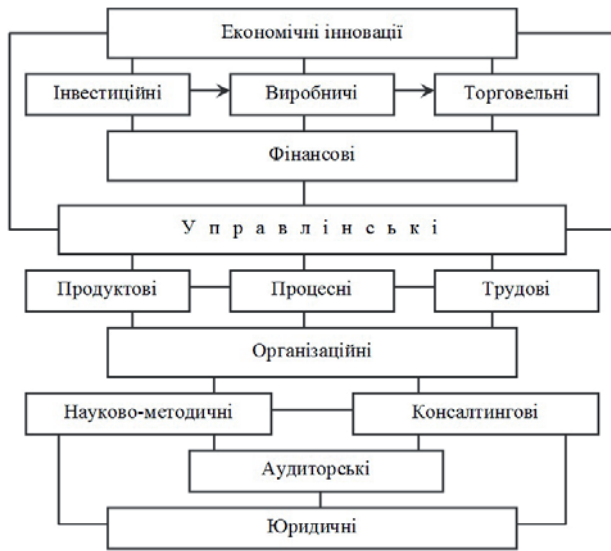
Рис. 3. Класифікація економічних інновацій

не тільки транснаціональних, але й трансконтинентальних, виокремлення в окрему групу мегарегіональних, а також цивілізаційних та глобальних інновацій.