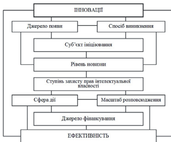
Рис. 1. Ключові ознаки систематизації інновацій

Зародження усіх новітніх тенденцій і процесів зумовлюють переосмислення багатьох базових категорій і понять, сформованих у межах традиційної інноватики, оновлення методології та інструментарію класифікації інновацій. Узагальнення та цільове селектування відповідних наукових підходів і методичних прийомів дозволяє достатньо чітко визначити наступні ознаки класифікації інновацій (рис. 1).