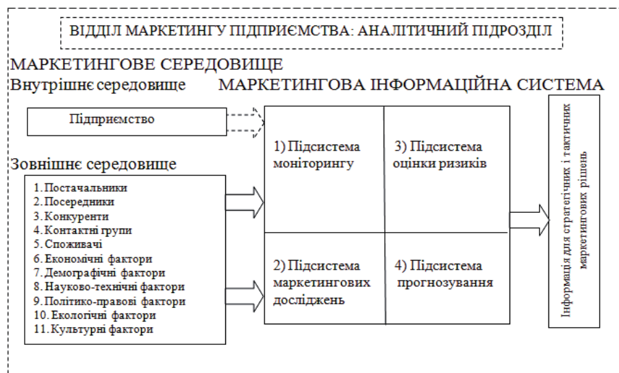
Рис. 3. Схема запропонованої неокласичної концепції маркетингової інформаційної системи підприємства: \dots — дані бухгалтерського, статистичного, управлінського обліку; \Rightarrow — маркетингова інформація

Пропонується схема неокласичної концепції маркетингової інформаційної підприємства (рис. 3).