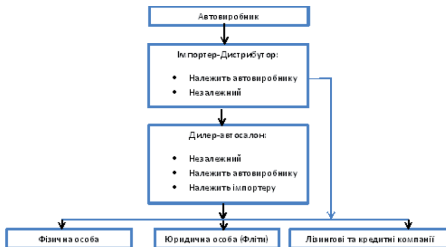
Рис. 1. Класична система розподілу на автомобільному ринку

Класична схема розподілу на автомобільному ринку представлена на рис. 1.