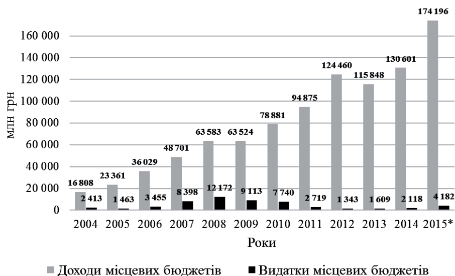
Рис. 2. Міжбюджетні трансферти місцевих бюджетів України у 2004–2015 р.р. (складено на основі [15, 17]). Примітка: * — дані щодо видатків міжбюджетних трансфертів з місцевих бюджетів наведено станом на 30.11.2015 р.

В сучасних умовах за даними Міністерства фінансів України обсяг міжбюджетних трансфертів збільшився у зрівнянні з попередніми роками, що представлено на рис. 2.