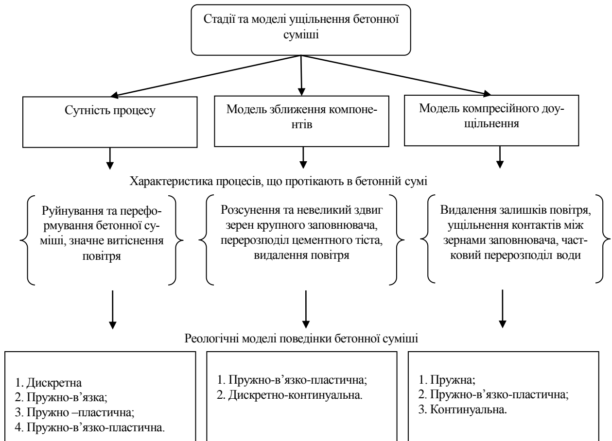
Рис. 3. Стадії ущільнення, їх характеристики та реологічні моделі.

Для наочності подання, оцінки напружено-деформованого стану та зміни пружно-дисипативних властивостей бетонної суміші в процесі віброущільнення різними дослідниками в різний час було розроблено більше десятка реологічних моделей поведінки ущільненої бетонної суміші.