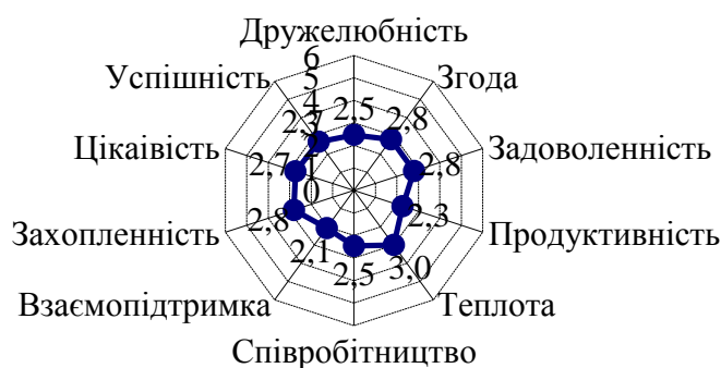
Рис. 1.3. Середній профіль психологічної атмосфери групи СР

Оскільки автор методики оцінки психологічної атмосфери пропонує аналізувати середній профіль у групі, а ми в ході анкетування отримали інформацію про оцінку студентами психологічної атмосфери в зазначених групах, ми побудували для кожної групи усереднений профіль у вигляді графіка. Визначення цих параметрів дозволило провести порівняльний аналіз студентських груп за станом психологічної атмосфери у студентських групах. Співвідношення усереднених графіків психологічної атмосфери в групах показало, що найбільш сприятлива психологічна атмосфера у групі СР, а більш несприятлива у групі ЕТ (рис. 1.3; 1.4).