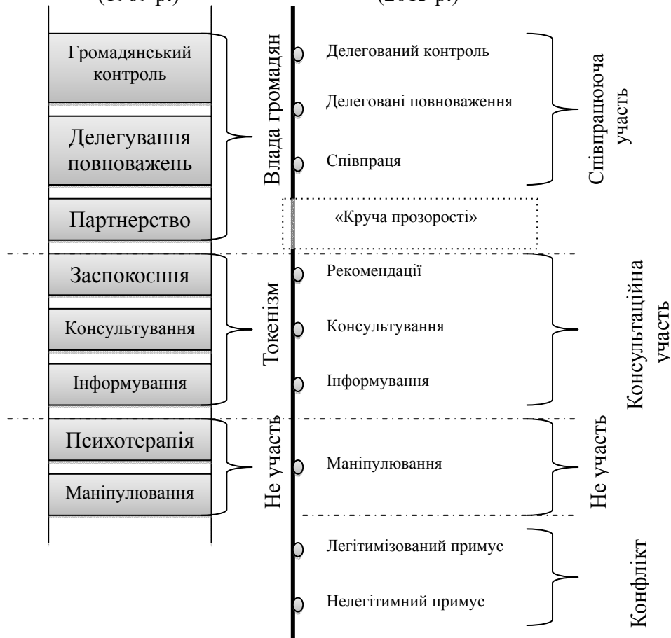
Рис. 2. Сходи участі за П.Пріето-Мартіном та А.Рамірез-Алюясом